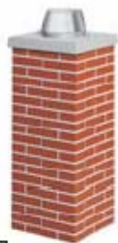
Kaminkopf die dauerhafte Verkleidung