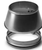
Abströmkonus + Zentrierung