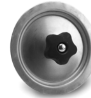
Revisionsverschluss für Öl und Gas