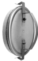
Revisionsverschluss für Festbrennstoffe