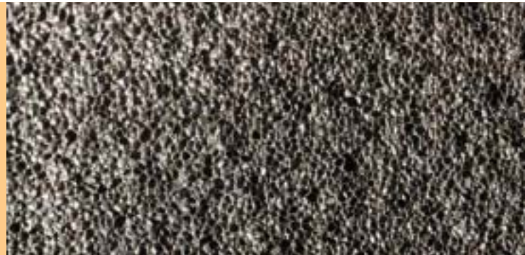
Schaumglas - Detail